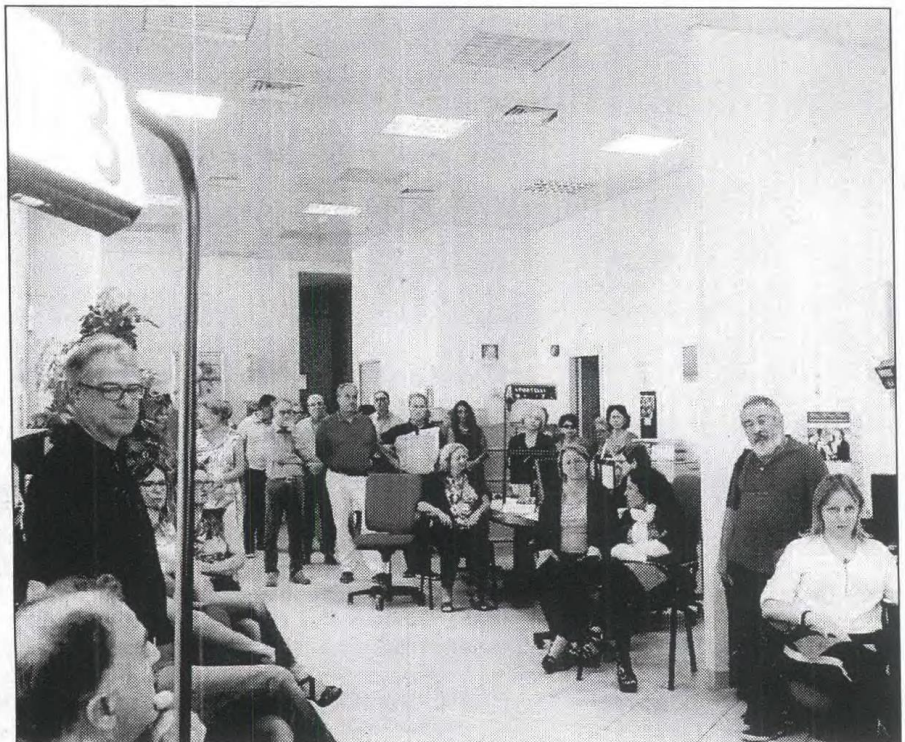
L'Assemblea dei lavoratori dell'Agenzia delle Entrate

Un quadro, questo, in cui è stato stigmatizzato l'accorpamento di Equitalia che, con lo pseudonimo di "Agenzia Entrate- Riscossione", anziché attenuare le insopportabili ed inique vessazioni procurate dalla vecchia Spa Equitalia ai danni dei contribuenti, ne ha accentuato la di-